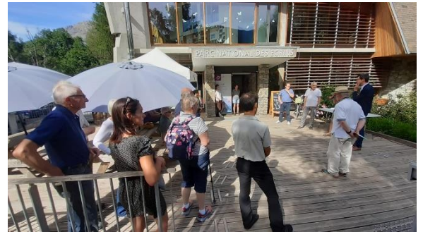
Vernissage en présence des élus du département et de la direction du Parc National des Ecrins

Depuis le 15 juin, la Maison du Parc National des Ecrins de Vallouise accueille notre exposition « Refuges de bois, les hommes, les outils, les gestes ». L'exposition est ouverte à tous, gratuite et aux heures d'ouverture de la Maison du Parc, et jusqu'à la Toussaint. Elle comprend : Une douzaine de panneaux racontant l'histoire de la construction des refuges des Écrins, les outils utilisés par les artisans, leurs gestes et une xylothèque permettant d'appréhender les caractéristiques des différences essences d'arbres, résineux et feuillus, de notre département.